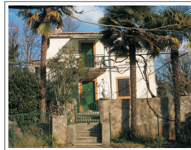
Kuća u Risiki u kojoj je bilo Sirotište sv. Josipa

Umrla je na glasu svetosti, 29. rujna 1922. godine u Rijeci. Posljednje riječi bile su joj: "Rado ostavljam zemlju, jer sam izvršila svoje poslanje." Njeno tijelo počiva na gradskom groblju Kozala u Rijeci. U tijeku je postupak da se proglasi blaženom. Njezino djelo nastavile su njezine duhovne kćeri Družbe Presvetog srca Isusova djelujući u šest biskupija u Hrvatskoj, Italiji i Njemačkoj. U Rijeci je 28. travnja 2008. svečano postavljena ploča s imenom ulice Prolaz Marije Krucifikse Kozulić